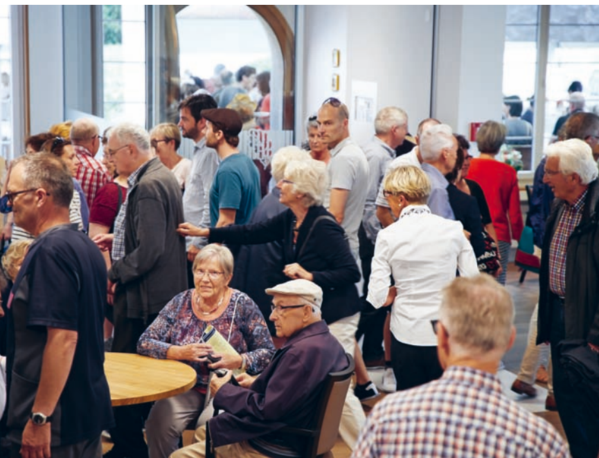
Am Tag der offenen Tür, am 19. August 2017, besichtigten Hunderte von interessierten Personen das sanierte und erweiterte Alters- und Pflegeheim.

Die Geschichte des Hauses begann schon vor 116 Jahren. 1902 startete die Kurhausgesellschaft Luzern die Initiative für den Bau des Altersheims Unterlöchli. 1906 konnte sie die Gemeinnützige Gesellschaft Luzern (GGL) gewinnen, die Trägerschaft für das künftige Haus zu übernehmen. Diese verfügte mit der Liegenschaft Unterlöchli über das notwendige Bauland, welches ihr von Jean Balmer in grosszügiger Weise geschenkt wurde. 1911 entstand aus dem Kreis der Gemeinnützigen Gesellschaft Luzern die heutige Gesellschaft Altersheim Unterlöchli. Somit ist sie eine Tochter der GGL und kann noch heute in der täglichen Arbeit auf Synergien mit der Muttergesellschaft zählen.